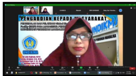
Gambar 1. Pengenalan Situs GBIF.

Berikut foto-foto kegiatan pengabdian pada Mahasiswa Program Studi Pendidikan Biologi, FSTT, Universitas Pendidikan Mandalika.