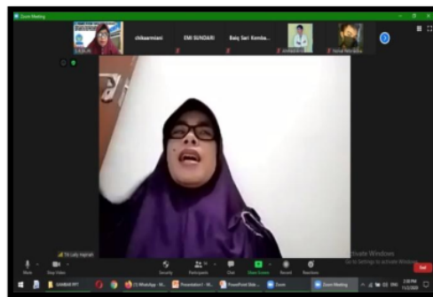
Gambar 3. Pemaparan Contoh-contoh Judul Skripsi yang Bisa Dianalisis dari Situs GBIF.