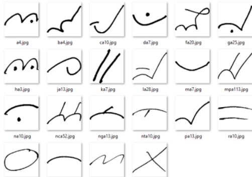
Gambar 3. Hasil Citra Tulisan Tangan Aksara Bima.

Setelah proses akuisisi dilakukan, selanjutnya dilakukan cropping sehingga masing-masing responden menghasilkan 12 buah tulisan tangan untuk satu karakter. Sehingga didapatkan dataset aksara Bima sejumlah 2640 citra. Setelah itu ukuran citra akan diubah menjadi 64 x 64 piksel dan disimpan dalam bentuk jpg seperti pada Gambar 3.