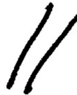
Gambar 5. Bentuk Aksara ka

bentuk Aksara ha dan a seperti yang ditampilkan pada Gambar 5.