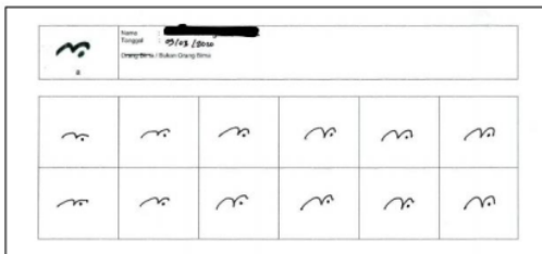
Gambar 2. Citra hasil scan tulisan tangan aksara Bima

Pada penelitian ini, pengumpulan data melibatkan 10 orang responden. 10 orang responden ini akan diminta untuk menuliskan 22 karakter aksara Bima sebanyak 12 kali penulisan untuk setiap karakter. Setiap karakter ditulis pada kertas berukuran F4 dengan menggunakan ballpoint ukuran 1.0 mm. Selanjutnya dilakukan proses digitalisasi menggunakan scanner dengan pengaturana dpi sebesar 600 dpi. Citra hasil scan tulisan tangan aksara Bima ditampilkan pada Gambar 2.