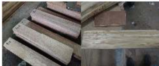
Gambar 2. Hasil pengampaan 24 jam papan laminasi kayu jati putih dan bambu petung