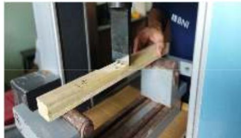
Gambar 3. Pengujian Mekanika Kayu

(Herawati et al., 2008). Balok laminasi yang telah jadi, dipotong untuk dibuat contoh pengujian sifat fisika dan mekanika dengan ukuran contoh sebagai berikut: kadar air (4 cm × 4 cm × 3 cm), perubahan dimensi (4 cm × 4 cm × 3 cm), Modulus of elasticity dan Modulus of rupture (5 cm × 3 cm × 45 cm).