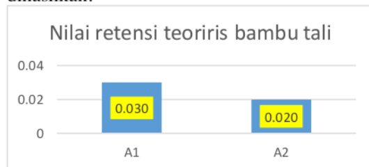
Grafik 3.2. Nilai rata-rata retensi teoritis bambu tali

Nilai retensi teoritis bambu galah berkisar antara 0,010- 0,040 gr/cm 3 . nilai retensi teoritis bambu tali yang dihasilkan lebih rendah bila dibandingkan dengan nilai retensi teoritis pada penelitian Novitasari (2019) menggunakan ekstrak daun tembelegen sebagai bahan pengawet alami yang diaplikasikan pada bambu ater menghasilkan kisaran nilai retensi teoritis sebesar 0,030-0,090 gr/cm 3 . Perbedaan nilai retensi teoritis yang dihasilkan dipengaruhi oleh perbandingan bahan pengawet yang digunakan, lama waktu perendaman serta perbedaan jenis bahan pengawet. Perendaman yang semakin lama akan memberikan kesempatan bambu untuk menyerap bahan pengawet sehingga nilai retensi teoritis ikut meningkat. Teori tersebut didukung dengan pernyataan Abdurrohman dan Martono (2002) cit Arumsari (2016) bahwa lama perendaman dingin dalam jenis dan konsentrasi yang sama sangat berpengaruh nyata terhadap retensi bahan pengawet yang dihasilkan.