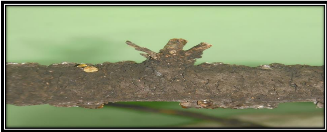
Gambar 2. Contoh tularan kutu lak yang tidak baik

Teknik penularan yang baik dengan menggunakan kantung strimin untuk menghindari serangan parasit dan predator. Berdasarkan pemantauan kami dilapangan masyarakat lebih menyukai tidak menggunakan kantung strimin karena menurut mereka kutu lak lebih cepat penularan dengan tanpa kantung strimin, tetapi dampaknya tularan kutu lak hasilnya tidak baik (tularan tidak penuh/terputus-putus dan berwarna kehitaman). Hal ini disebabkan serangan parasit dan predator (biasanya semut merah besar).