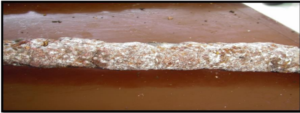
Gambar 1. Contoh bibit lak cabang yang baik

Teknik penularan yang baik dengan menggunakan kantung strimin untuk menghindari serangan parasit dan predator. Berdasarkan pemantauan kami dilapangan masyarakat lebih menyukai tidak menggunakan kantung strimin karena menurut mereka kutu lak lebih cepat penularan dengan tanpa kantung strimin, tetapi dampaknya tularan kutu lak hasilnya tidak baik (tularan tidak penuh/terputus-putus dan berwarna kehitaman). Hal ini disebabkan serangan parasit dan predator (biasanya semut merah besar).