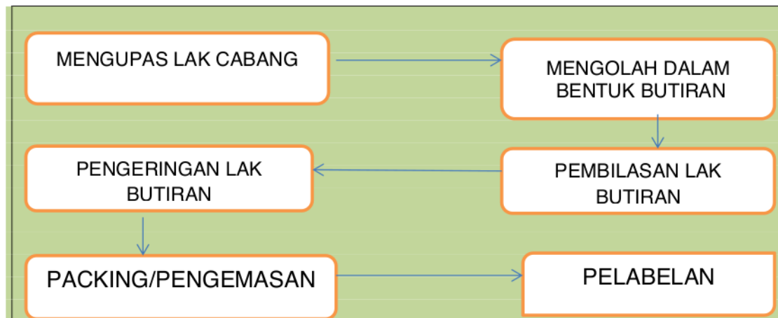
Gambar 4. Bagan alur teknologi pasca panen lak (Wulandari.F.T, 2011).