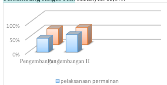
Gambar 4. Rekapitulasi Hasil Pengembangan Pelaksanaan Permainan Busy Book dalam Meningkatkan Kemampuan Kognitif Anak Kelompok B.

angka. Sehingga berdasarkan tabel di atas didapat jumlah rata-rata persentase indikator anak yang berkembang sangat baik sebanyak 15,8%.