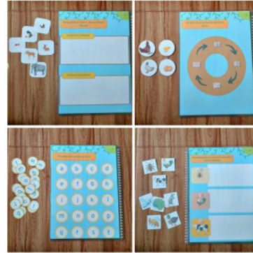
Gambar 2. Busy Book

Penelitian ini menghasilkan sebuah produk berupa media pembelajaran Busy book yang dapat dilihat pada Gambar 2.