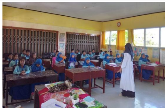
Gambar 2. Proses pembelajaran

SDN 2 Kuranji menyatukan nilai karakter disiplin pada pembelajaran yaitu guru menyatukan karakter disiplin pada peserta didik kelas rendah melalui silabus dan RPP. Dimasukkannya karakter kedisiplinan disesuaikan dengan tema dan materi pembelajaran. Guru juga mencantumkan nilai karakter disiplin pada saat berlangsungnya proses belajar. Dengan dicantumkannya nilai karakter disiplin di dalam kegiatan pembelajaran diharapkan mampu untuk menggapai tujuan yang diinginkan, begitu juga yang dijelaskan oleh (Mustoip et al., 2018) bahwa delapan belas nilai karakter berperan sebagai patokan dalam pelaksanaan kurikulum 2013, nilai-nilai karakter itulah yang diharapkan mampu untuk mewujudkan karakter yang baik melalui pengimplementasian pendidikan karakter di sekolah.