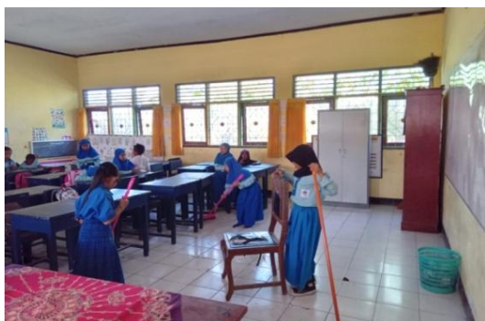
Gambar 1. Kegiatan rutin melakukan piket

peserta didik, kemudian memberikan sosialisasi di lingkungan sekolah dan ruang kelas mengenai aturan dan tata tertib sekolah. Upacara juga merupakan kegiatan rutin yang dilakukan SDN 2 Kuranji setiap hari senin dan nasional, sebelum upacara dimulai guru memisahkan barisan peserta didik yang melakukan pelanggaran, setelah upacara selesai, peserta didik yang melakukan pelanggaran mendapatkan evaluasi (Hasil wawancara kepala sekolah dan guru kelas, 20 Februari 2023).