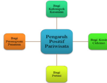
Gambar 4.3 Pengaruh Positif Pariwisata

Dalam konteks Setanggor, kehadiran industri pariwisata dapat memberikan manfaat secara ekonomi dan terjaganya ketahanan sosial-budaya masyarakat lokal serta mengurangi dampak negatif terhadap lingkungan. Oleh karena itu, antusiasme masyarakat yang tinggi dalam melihat sektor pariwisata bisa menjadi modal yang sangat berharga dalam membenahi dan membangun destinasi wisata yang memiliki peluang ekonomis bagi masyarakat lokal.