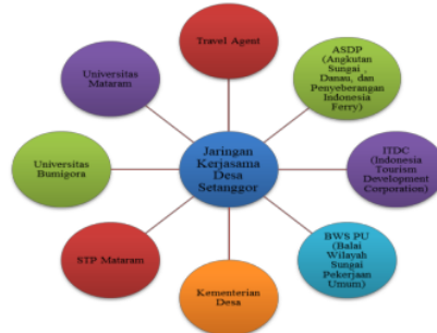
Gambar 4.5 Kerjasama Desa Setanggor

dengan konsep pentahelix (pemerintah, swasta, media, akademisi, dan komunitas). Menjalin mitra dengan pihak perguruan tinggi (akademik), pemerintah setempat dan komunitas-komunitas lainnya sebagai upaya untuk meningkatkan kapasitas SDM dalam mengembangkan pariwisata halal Desa Setanggor.