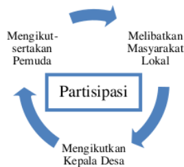
Gambar 4.1 Pendekatan Partisipatif

Upaya-upaya yang dilakukan pengelola desa wisata untuk menstimulasi kesadaran semua unsur kalangan masyarakat tentang pentingnya support dari mereka dalam proses pengembangan pariwisata halal yang berkelanjutan di Desa Setanggor.