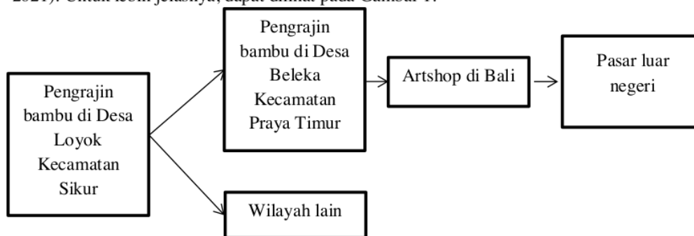
Gambar 1. Saluran Pemasaran Tidak Langsung

Dalam melakukan suatu pemasaran, pengusaha harus menentukan sistem pemasaran yang akan dilakukan terlebih dahulu. Berdasarkan penelitian yang telah dilakukan, pengusaha kerajinan anyaman bambu di Desa Loyok menggunakan sistem pemasaran tidak langsung. Dimana sistem pemasaran tidak langsung ini merupakan sistem pemasaran yang menggunakan saluran pemasaran atau media pemasaran dalam memasarkan produknya (Fahrurrozi & Mispandi, 2021). Untuk lebih jelasnya, dapat dilihat pada Gambar 1.