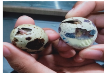
Gambar 2. Kematian Embrio Akhir

kerabang, dan kematian setelah beberapa saat setelah menetas (Gambar 2).