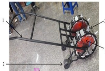
Gambar 1. Alat tanam biji jagung sistem dorong baris ganda: (1) tangkai kemudi, (2) roda penutup lubang, (3) alat penjatah benih, (4) tempat pemasukan benih

Tangkai kemudi alat tanam terbuat dari besi silinder berdiameter 2,5 mm. Mulut tanam berbentuk tirus dengan ukuran 80 mm. Rotor penjatah dan tangki bernih terbuat dari plastik akrilik setebal 0,3 mm. Alat penutup lubang terbuat dari besi silinder dengan diameter 100 mm.