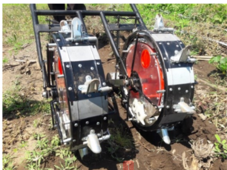
Gambar 4. Uji lapangan alat tanam biji jagung sistem dorong baris ganda di lahan sawah milik petani di Desa Gumantar Kabupaten Lombok Utara

Setelah dilakukan uji laboratorium, diperoleh hasil yang menunjukkan bahwa semua komponen alat tanam biji jagung baris ganda sistem dorong telah berfungsi dengan baik. Lalu dilanjutkan uji lapangan di lahan sawah milik petani di Desa Gumantar Kabupaten Lombok Utara (Gambar 4). Luas lahan yang digunakan untuk uji lapangan adalah 375 m 2 (25 x 15 m). Jarak dan baris tanaman telah ditentukan berdasarkan hasil penelitian pendahuluan yaitu 0,2 x 0,35 m.