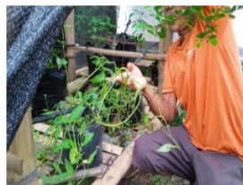
Gambar 10. Tanaman kangkung darat

Uji tanaman kangkung didalam polybag merupakan penanaman tanpa penggenangan seperti biasanya yang dilakukan oleh masyarakat tani kangkung di Lombok pada umumnya. Kangkung ini diberikan air irigasi hanya untuk memenuhi kelembaban tanah saja, sehingga jumlah air yang digunakan sangat terukur. Lihat Gambar 10, kangkung yang umurnya telah lebih dari tiga minggu.