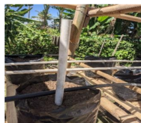
Gambar 7. Kedalaman irigasi

Berdasarkan hasil uji di atas terlihat jelas bahwa pada pipa tetes pvc, diperlukan durasi irigasi paling kecil dan untuk mencapai kedalaman 21 cm memerlukan waktu hanya 25 menit, dibandingkan dengan pipa tetes NTF yang lebih lama 10 menit. Oleh karena itu dalam hal ini penggunaan pipa pvc mungkin akan sangat membantu jika digunakan pada seluruh tingkat karena durasi irigasinya lebih pendek. Bila ditinjau hasil uji Negara.dkk (2010) bahwa resapan irigasi pada tanah pasiran untuk penggunaan pipa tetes dripe tipe dan true drip diperoleh resapan pada arah mendatar satu -dua kali lebih besar dari pada ke dalam tanah, sedangkan pada pipa driptipe peresapan air irigasi arah lateral diperoleh hanya satu setengah kali kedalam tanah. Pada kondisi lahan terbatas hanya selebar diameter polybag (30 cm) dan kedalaman tanah hanya 21 cm, maka pola peresapan irigasinya diperkirakan memiliki kecenderungan tertentu. Uji kedalaman resapan pada polybag dilakukan seperti pada Gambar 7.