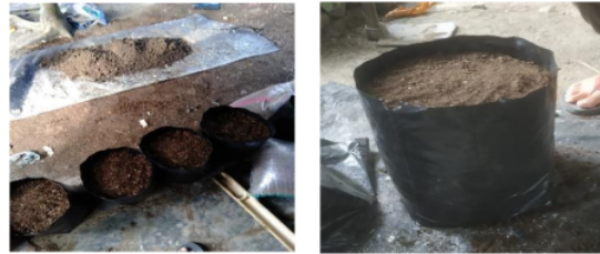
Gambar 2. Pembuatan media irigasi dalam bentuk lahan polybag.

tanah sebesar 4 cm ke ujung atas polybag. Gambar 2 berikut adalah penyiapan campuran media irigasi pada polybag.