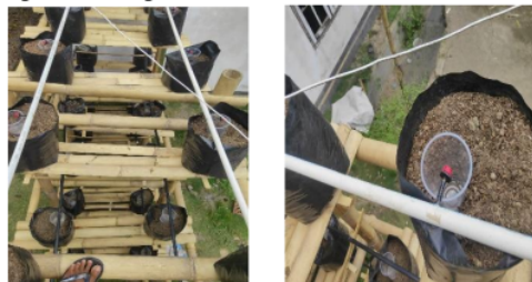
Gambar 6. Uji keseragaman irigasi

Keseragaman irigasi tetes NTF dan pvc sistem bertingkat secara parsial memberikan hasil yang rata-rata di atas 95% termasuk sangat baik, dan jika dihitung secara keseluruhan sebagai keseragaman gabung juga menunjukkan keseragaman yang tinggi diatas 95%. Uji irigasi tetes bertingkat dapat dilihat pada Gambar 6.