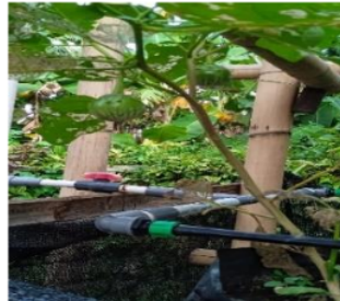
Gambar 9. Tanaman terong hijau dengan irigasi tetes bertingkat

Uji tanaman terong pada irigasi tetes bertingkat telah menunjukkan hasil yang telah berbuah dengan cukup bagus, irigasi yang diberikan telah mampu memberikan air yang cukup pada tanaman sehingga tanaman dapat berbunga dan berbuah.