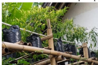
Gambar 8. Tanaman cabe Kara dengan irigasi tetes bertingkat

Uji irigasi tetes bertingkat dengan tanaman hortikultura telah menunjukkan hasil yang cukup bagus, dimana irigasi yang diberikan telah mampu memberikan air yang cukup pada tanaman di semua tingkat jaringan dan tanaman telah berbuah seperti pada Gambar 8.