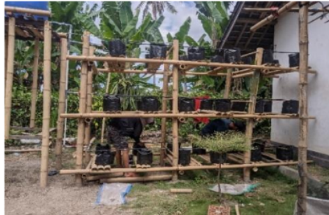
Gambar 4. Jaringan irigasi tetes bertingkat

Data-data yang dianalisis dalam tahap ini adalah data keseragaman irigasi, kedalaman resapan irigasi dan volume irigasi. Hasil analisis dipresentasikan dalam bentuk tabel dan grafik serta dibahas dan dikaitkan dengan pustaka dalam pengambilan kesimpulan.