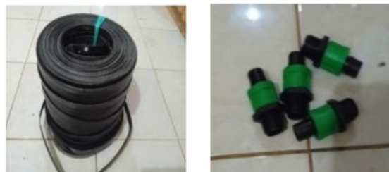
Gambar 1. Pipa NTF, konektor dan emitter

Tahap penelitian ini mencakup persiapan material pipa pvc ¼”, pipa NTF 12mm, bambu, polybag 35 cm, drum kapasitas 200 liter ,pipa NTF dan konektor pipa NTF ke pvc, seperti Gambar 1. Uji dilakukan pada jaringan irigasi tetes pipa Netafim (NTF) 12 mm dan jaringan distri businya pipa pvc 1” pada lantai 3, pipa pvc ¾” pada jaringan lantai 2 dan pipa pvc ½” pada lantai 1.