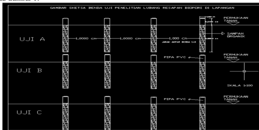
Gambar 1. Sketsa pemasangan pipa lubang resapan biopori

Pemasangan biopori dilakukan mengikuti skema rancangan pemasangan pipa biopori pada lahan uji seperti pada Gambar 1.