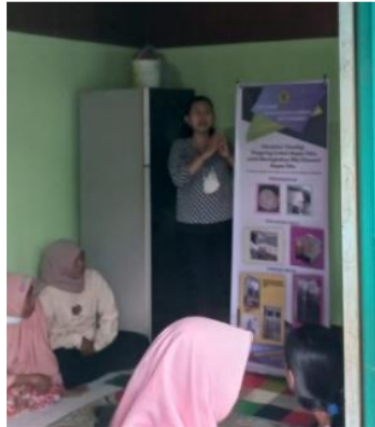
Gambar 2. Penjelasan metode pengeringan ampas tahu

Kegiatan penyuluhan dan pelatihan mencakup beberapa aspek yaitu: 1) Penanganan limbah ampas tahu. 2) Proses pengeringan ampas tahu. 3) Pengemasan ampas tahu. 4) Penyimpanan ampas tahu. Dan 5) Produk olahan dari ampas tahu. Kelima aspek tersebut disampaikan oleh tim pengabdian FATEPA.