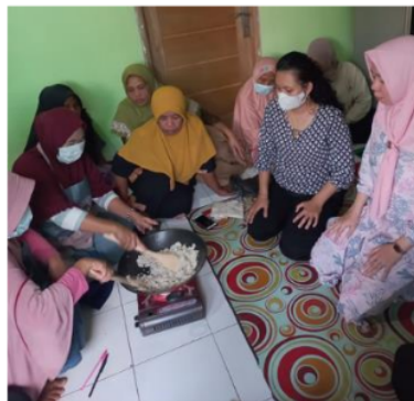
Gambar 3. Kegiatan praktik pengeringan ampas tahu dengan metode sanghrai

Dengan materi penanganan limbah ampas tahu pengrajin tahu kekalik menjadi lebih peduli akan dampak lingkungan apabila ampas tahu tidak dimanfaatkan dengan baik. Selain itu pengrajin juga sangat bersemangat dengan nilai guna ampas tahu yang sudah dikeringkan. Penjelasan mengenai proses pengeringan ampas tahu menjadi salah satu solusinya. Berbagai teknik dan metode dijelaskan serta dilakukan proses yang paling sederhana yang dapat dipraktikkan masyarakat langsung, yaitu metode penyangraian. Penyangraian ampastahu dapat dilakukan langsung menggunakan wajan besar dan dengan media pemanas dari kompor. Kesesuaian panas yang digunakan akan mempengaruhi meratanya hasil penyangraian ampas tahu. Proses penyangraian dapat menghilangkan sebagian besar kandungan air pada ampas tahu, sehingga kadar airnya menjadi rendah dan lebih tahan lama. Selain praktek langsung, pengrajin tahu juga ditunjukkan berbagai alat yang dapat digunakan untuk mengeringkan ampas tahu agar ampas tahu yang dihasilkan berkadar air rendah serta terjaga higienitasnya.