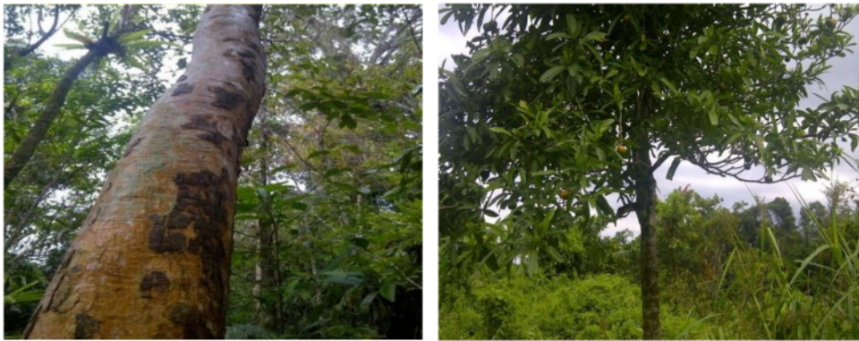
Gambar 3. Klokos ( Syzygium javanica ) dan Kumbi ( Voacanga sp. )