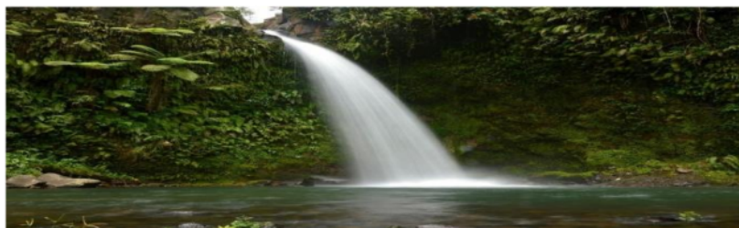
Gambar 5. Air Terjun Segenter Figure 5. Segenter Waterfall

Stipa yang mengalir sepanjang Tahura. Keberadaan sungai Stipa menjadi daya tarik tersendiri karena di beberapa titik memiliki pemandangan yang indah yang bisa dimanfaatkan oleh para pengunjung sebagai tempat istirahat setelah menelusuri jalan setapak di Tahura. Potensi perairan lainnya yaitu pancuran OISCA (Anonim, 2020). Pancuran air ini mengeluarkan air segar yang bahkan bisa diminum langsung maupun bisa digunakan untuk membersihkan badan bagi yang ingin merasakan segarnya air pegunungan. Daya tarik utama dari potensi perairan di kawasan Tahura Nuraksa adalah air terjun Segenter berjarak sekitar 2,8 km dari pintu gerbang Tahura Nuraksa. Air terjun ini bisa dicapai dengan berjalan kaki atau kendaraan roda dua. Keberadaan obyek wisata ini sudah dikenal luas oleh masyarakat, sehingga warga yang datang berkunjung kebanyakan berasal dari luar Desa Pakuan. Debit air yang konstan menjadi daya tarik tersendiri bagi masyarakat untuk menikmati kesejukan air terjun terutama saat musim kemarau. Selain air terjun Segenter, masih ada satu lagi air terjun walaupun terletak di luar Tahura Nuraksa yaitu air terjun Elenpati. Walaupun berada di luar kawasan Tahura Nuraksa, air terjun Elenpati memiliki panorama yang menarik sebagai lokasi wisata dan didukung juga oleh akses jalan yang cukup baik.