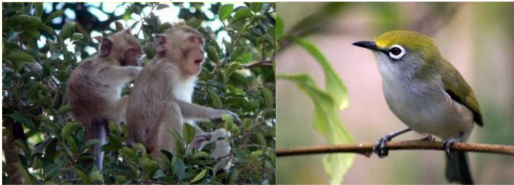
Gambar 4. Kera ekor panjang ( Macaca fascicularis ) dan Burung Kecial ( Zosterops palpebrosus )

Potensi fauna yang berhasil diidentifikasi baik perjumpaan langsung maupun berdasarkan informasi masyarakat pada wilayah tahura terdapat 38 jenis antara lain: biawak ( Varanus salvator ), kera ( Macaca Sp ), babi hutan ( Sus vittatus ), lutung ( Presbitis cristata ), rusa ( Rusa timorensis ), ular piton ( Phyton timorensis ), dan landak ( Hystrik branchiura ). Untuk satwa jenis aves didominasi oleh ayam hutan ( Gallus specdiv ), burung kecial ( Zosterops palpebrosus ), burung koak-kaok ( Philemon buceroides ) Setiawan A., 2022.