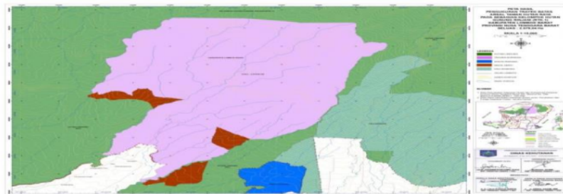
Gambar 2. Peta Kawasan Tahura Nuraksa

Kawasan Taman Hutan Rakyat (Tahura) Nuraksa terletak di dalam kawasan Gunung Rinjani yang secara administrasi berada di Kabupaten Lombok Barat dan Kabupaten Lombok Barat dengan areal seluas 3.155 ha. Secara geografis kawasan Tahura Nuraksa terletak antara 116°03' - 116°44' Bujur Timur dan 8°15' - 8°35' Lintang Selatan. Secara kewilayahan batas-batas kawasan Tahura Nuraksa adalah sebagai berikut: sebelah Utara: Hutan lindung Gunung Rinjani; Sebelah Timur: Hutan Kemasyarakatan (HKm) Aik Beriq dan KHDTK; Sebelah Selatan: Tanah milik masyarakat; dan Sebelah Barat: Hutan lindung Gunung Rinjani