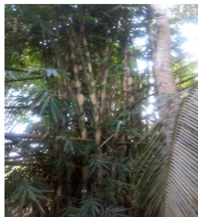
Gambar 7 Bambu Tali

Spesies : Gigantochloa apus (Bl. Ex Schult.) Kurz (Berlin dan Estu, 1995).