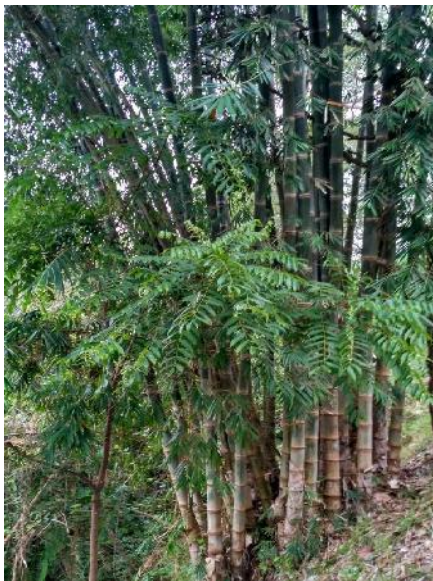
Gambar 5 Bambu Petung

Batang tanaman berbentuk silinder memanjang dan terbagi dalam ruas, tinggi 0,3-30 m, diameter 0,25-25 cm, tebal dinding 25 mm. daun berbentuk lanset, bagian ujung meruncing, pangkal tumpul, tepi rata, dan daging daun tipis, pertulangan daun sejajar, memiliki permukaan yang kasar dan berbulu halus. Daun berwarna hijau muda dan kekuningan. Warna bulu pada ujung rebung dan bulu yang ada pada pelepah berwarna coklat.