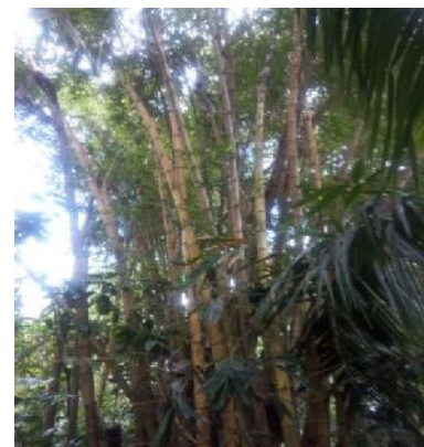
Gambar 4 Bambu Kuning

Bambu kuning ( Bambusa vulgaris Schard) merupakan pohon tahunan, tinggi 5-10 m. berkayu, bulat, berlubang, beruas-ruas, batang berwarna kuning, bergaris hijau membujur. Daun tunggal, berseling, berpelepah, berbentuk lanset, ujung meruncing, tepi rata, pangkal membulat, panjang 15-27 cm, lebar 2-3 cm, pertulangan sejajar, warna daun hijau. Bunga majmuk, bentuk malai, warna ungu kehitaman. Akar serabut, berwarna putih kotor