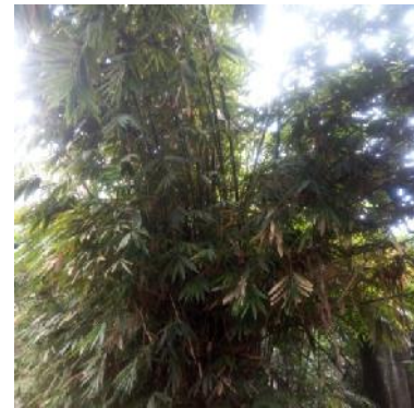
Gambar 3. Bambu Bilis

Spesies : Schizostachyum lima (Blanco) Merr