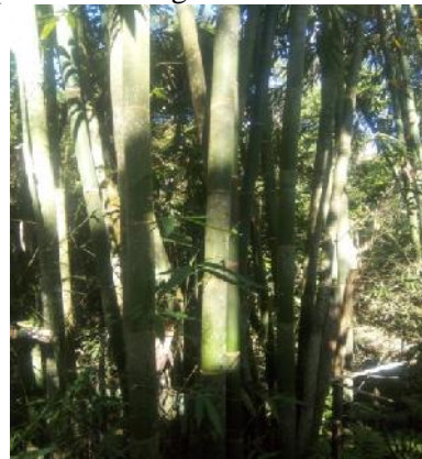
Gambar.6 Bambu Santong

Bambu santong memiliki batang hijau atau kekuning-kuningan, batang mencapai tinggi 20 m, tidak bercabang dibagian bawah, diameter 9-15 cm dengan tebal dinding 6-13 mm, panjang ruas bagian tengah 45-65 cm. bentuk batang teratur dengan buku-buku, tegak dan doyong, ukuran batang diameter 7-15 cm dan tinggi 14-16 m. batang muda tertutup bulu warna coklat, setelah tua batang berwarna hijau keunguan, rumpun padat. Daun tunggal berseling, berpelepah, bentuk lanset, ujung lancip, tepi rata, pangkal membulat, ukuran panjang 20-30 cm, lebar 4-6 cm. Akar serabut putih kekuningan.