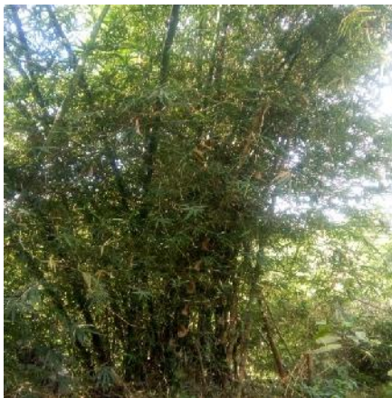
Gambar 2 Bambu Ampel

Spesies : Bambusa vulgaris Schrad. ex J.Ciba