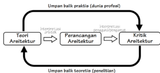
Gambar 1. Siklus teori arsitektur

Teori juga memiliki peran besar dalam kaidah-kaidah dan prinsip-prinsip perancangan arsitektur. Dalam proses perancangan arsitektur, teori dibutuhkan untuk melakukan pendekatan tipologis dan pendekatan tematik. Penguasaan teori arsitektur yang mumpuni akan menjamin perancangan arsitektur dapat dilakukan dengan baik.