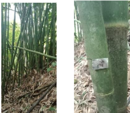
Gambar 5. Bambu Galah ( Gigantochloa atter (Hassk) Kurz ex Munro)

Bambu galah dikawasan HKm Aik Bual merupakan bambu kedua penyebaran terbanyak setelah bambu tali. Sama halnya seperti bambu tali, bambu ini juga tersebar di tepian sungai dan beberapa dilahan garapan. Bambu ini memiliki perawakan dengan warna hijau, pada tiap ruas dibagian atas buku terdapat bulu berwarna putih, sedangkan dibagian bawah buku berwarna hitam (Gambar 4.5 (b)). Jika diperhatikan bambu ini terlihat bersih, karena seludang yang cepat lepas dari buku (Gambar 4.5 (a)), dimana menurut Sutardi et al. (2015) seludang bambu galah akan terlepas dari buku setelah bambu berumur sekitar 6 bulan. Bagian pangkal bambu sampai tinggi tertentu, tidak terdapat ranting yang tumbuh pada buku. Pada bagian pangkal bambu yang dekat dengan permukaan tanah mempunyai akar tepat di bagian bukannya, sedangkan pada bagian buku lainnya tidak demikian.