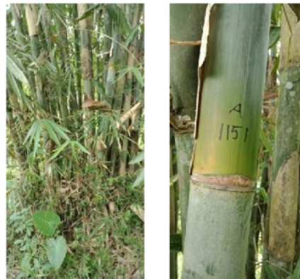
Gambar 2. 1 Bambu Tali ( Gigantochloa apus (B. Ex Schult.) Kurz)

Bambu tali yang terdapat dikawasan 1 HKM Aik Bual tersebar hampir diseluruh tepian sungai, baik pada sungai utama maupun pada anak sungai. Sementara pada bagian daerah lahan garapan tersebar dibeberapa bagian saja, dititik tetentu dimana masyarakat memang sengaja menanamnya sebagai buffer tanah. Demikian juga pada bagian daerah bibir sungai atau tepi sungai, sebagai penahan erosi. Bambu ini 1 ketika muda memiliki perawakan dengan warna hijau pada tiap ruas, umumnya dilapisi dengan lapisan berwarna putih yang jelas pada bagian bawah setiap buku, sedangkan pada bagian yang tertutup atau melekat padanya seludang berwarna kuning kehijauan (Gambar 4.2 (b)). Sementara pada bambu yang sudah tua atau siap dipanen, bambu ini akan berubah warna menjadi hijau