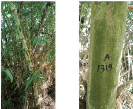
Gambar 3. 11 Bambu Petung ( Dendrocalamus asper Backer)

Bambu petung muda memiliki perawakan dengan kulit batang berwarna hijau yang dilapisi oleh lapisan seperti bulu berwarna kuning, terutama pada bagian-bagian pangkal dan tepat terletak di atas buku, sedangkan pada bagian tengah sampai ujung batang dilapisi dengan warna putih kecokelatan (Gambar 4.3 (b)). Sementara pada bambu tua akan dijumpai dengan warna hijau kekuningan yang dilapisi oleh bercak-bercak putih (Gambar 4.3 (a)). Sutardi et al. (2015) menjelaskan bahwa seludang bambu ini sangat mudah lepas, sehingga saat muda saja bambu ini sudah tidak terlihat seludang di batangnya. Bagian buku bambu ini tumbuh ranting dan nampak akar pada bagian-bagian pangkal yang dekat dengan permukaan tanah.