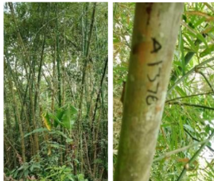
Gambar 4. Bambu Ampel ( Bambusa vulgaris Scharder ex Wendland)