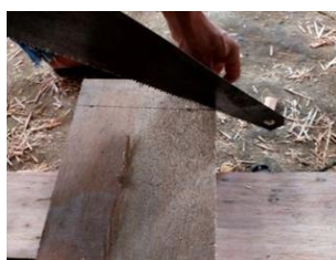
(ii) Potong kayu menjadi berukuran lebar 40 cm dan panjang 70 cm