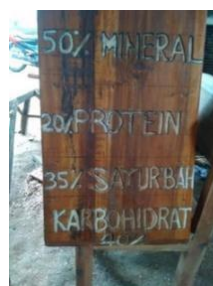
(v) menuliskan makanan sehat dibagian samping media piramida menggunakan profil