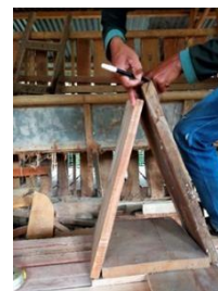
(iii) Rakit kayu menjadi bentuk piramida