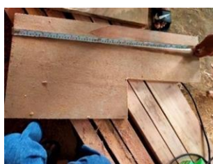
(i) Siapkan kayu batur

Berdasarkan hasil rancangan atau desain yang telah dibuat sebelumnya maka dilakukan tahapan pengembangan produk utama berupa media PIRAMASE. Kayu batur digunakan sebagai bahan dasar dalam pengembangan produk PIRAMASE dengan langkah-langkah disajikan pada gambar 1.