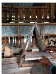
(iv) memasang rak kayu pada media piramida