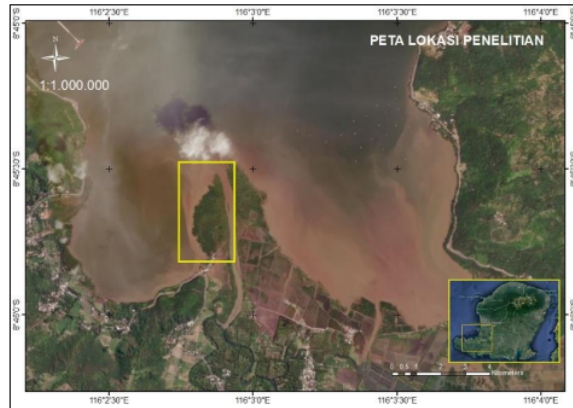
Gambar 1. Peta Lokasi Penelitian Figure 1. Research Location Map

Penelitian ini dilaksanakan pada Bulan Agustus sampai dengan Oktober 2021 di hutan mangrove Tanjung Batu Desa Sekotong Tengah, Kecamatan Sekotong, Kabupaten Lombok Barat. Lokasi penelitian ditunjukkan dalam Gambar 1.