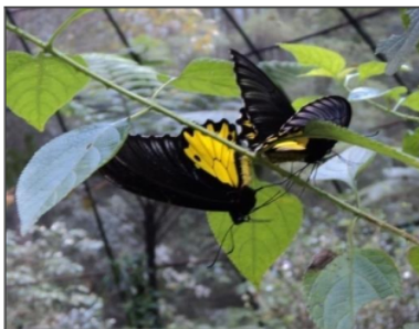
Gambar 3 Perkawinan pada kupu-kupu

Kupu-kupu kawin hanya satu kali, selanjutnya betina dapat bertelur. Kupu-kupu betina memiliki kemampuan menyimpan sel kelamin jantan sehingga dapat digunakan ketika diperlukan. Perkawinan pada kupu-kupu dilakukan dengan cara menempel, bagian ujung abdomen jantan menjepit ujung abdomen betina. Perkawinan pada kupu-kupu dapat berlangsung sekitar 6-8 jam setelah itu kedua kupu-kupu terlepas dan betina dapat bertelur beberapa hari kemudian. Perkawinan pada kupu-kupu dapat dilihat pada Gambar 3.