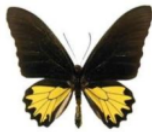
Gambar 1 Kupu-kupu Troides helena

T. helena merupakan jenis kupu-kupu dilindungi di Indonesia berdasarkan PP Nomor 106 tahun 2018 dan SK. Mentan No. 576/Kpts/Um/8/1980 serta termasuk jenis satwa Appendix II (CITES, 2021) sehingga upaya penangkarnya diharapkan dapat membantu mengurangi pemanfaatan satwa ini di alam secara langsung. Kupu-kupu tidak dilindungi seperti jenis Papilio sp dan P. aristolochiae dapat dilihat pada Gambar 2.