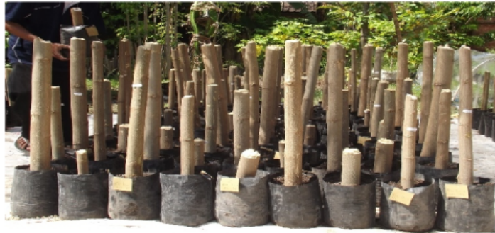
Gambar 11. Berbagai ukuran stek batang yang dapat dijadikan bahan stek untuk pembibitan kelor secara vegetatif.