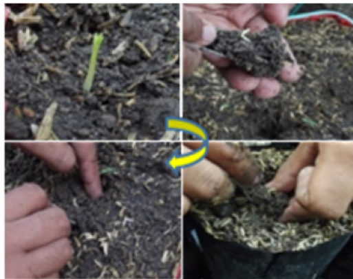
Gambar 7. Pencungkilan/pencabutan semai siap pindah tanam dan kemudian penanaman semai di media pembibitan dalam polibag.

Pencungkilan atau pencabutan semai dilakukan dengan alat yang sesuai (dapat menggunakan sendok makan), secara hati-hati agar akar semai tidak rusak (terputus) ketika diangkat. Semai kemudian ditanam dalam media polibeg lalu media di sekitar lubang tanam dipadatkan seperlunya agar semai berdiri dengan tegak dan kokoh.