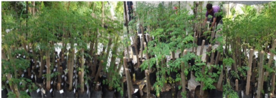
Gambar 17. Bedengan bibit asal stek batang yang telah siap dipindahtanam ke lapang produksi.

Perlu kehati-hatian dalam penanganan bibit saat akan dilakukan pengangkutan. Jika pengangkutan bibit dengan kendaraan terbuka, pastikan dipersiapkan pelindung angin. Angin yang cukup kencang akan mudah mematahkan tunas-tunas bibit, terutama tunas yang baru terbentuk.