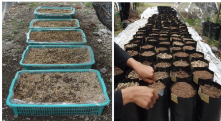
Gambar 2. Tempat pesemaian sederhana untuk pembibitan tanaman kelor (kiri) dan media polibag untuk memindah-tanamkan semai yang tumbuh normal (kanan) dan kemudian akan menghasilkan bibit berkualitas.

Manfaat atau fungsi utama dari pesemaian dalam pengembangan tanaman kelor sebagai sumber pangan sehat maupun sumber alternatif bahan bakar nabati adalah untuk menyediakan bibit tanaman kelor, dalam jumlah yang tepat dan berkualitas baik. Fungsi lain dari pesemaian ini adalah sebagai sarana unit produksi bibit tanaman kelor yang berkualitas dalam rangka usaha pengembangan tanaman ini.