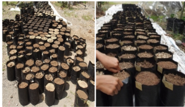
Gambar 6. Media sapih atau pembibitan dalam Polibeg yang siap ditanami semai.

Kegiatan penyapihan semai atau pindah tanam ke media dalam polibeg pembibitan diawali dengan penyiapan media sapih atau media pembibitan. Media pembibitan yang baik harus memenuhi kriteria, ringan, memiliki kepadatan ( bulk density ) rendah, drainase dan aerasi baik sehingga memudahkan pertukaran udara dan air, kemampuan menahan air cukup baik, pengembangan dan penyusutan media sangat rendah sehingga tidak merusak akar saat kekeringan, tersedia dalam jumlah memadai dan mudah diperoleh dengan harga keekonomian. Selain dari pada itu, bahan media harus steril, bebas hama dan penyakit, dan tentunya mengandung unsur hara yang cukup bagi kebutuhan pertumbuhan bibit.