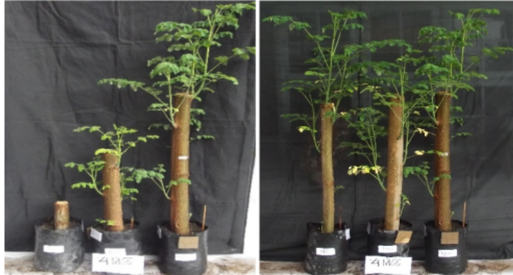
Gambar 15. Keragaan bibit kelor asal stek batang berbeda panjang (kiri) dan berbeda diameter (kanan) saat berumur 1 bulan.

memberikan pencahayaan sekitar 80-85 persen atau tingkat naungan 15-20 persen. Hal ini berbeda dengan pembibitan dengan menggunakan biji. Pembibitan kelor dengan menggunakan biji tidak memerlukan naungan buatan seperti paranet. Hal ini dikarenakan jika pembibitan tanaman kelor dengan menggunakan stek batang tidak dinaungi, maka bahan perbanyakannya yang berupa stek batang akan mudah kering sebelum tumbuh dan berkembang menjadi bibit.