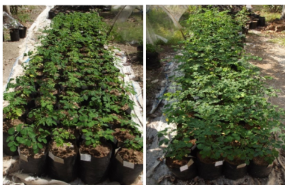
Gambar 8. Bibit tanaman kelor pada polibag saat umur 1 bulan (kiri) dan 2 bulan (kanan).