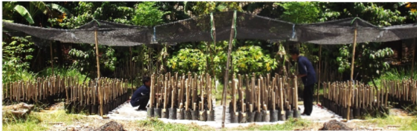
Gambar 12. Penanaman berbahan paranet hitam dengan konstruksi sederhana pada pembibitan tanaman kelor asal stek batang.

Pembibitan tanaman kelor dengan menggunakan stek batang memerlukan penanaman terutama pada tahap awal pertumbuhannya. Hasil percobaan menunjukkan bahwa penanaman pembibitan tanaman kelor dengan menggunakan stek batang hanya diperlukan pada periode satu bulan pertama. Periode tersebut merupakan periode dimana tunas mulai tumbuh dan berkembang demikian pula halnya dengan akar. Pada saat itu kelembaban yang diperlukan cukup tinggi dan suhu yang diperlukan cukup rendah.