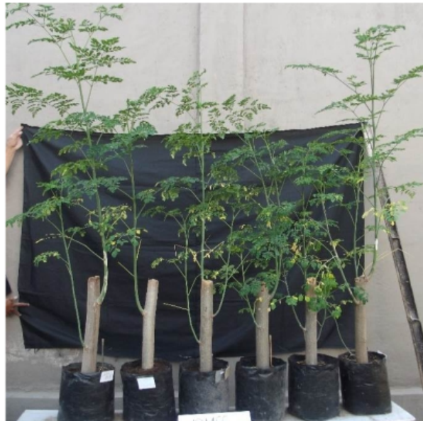
Gambar 19. Bibit tanaman kelor asal stek batang berumur 10 minggu pada media tanah dan berbagai macam media organik (dari kiri ke kanan: tanah, tongkol jagung, serbuk gergaji kayu, cocopeat , seresah daun bambu, dan arang sekam padi).