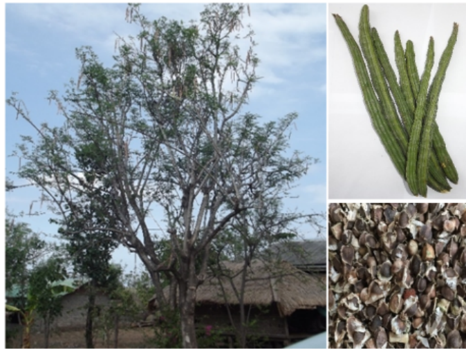
Gambar 1. Tanaman kelor ( Moringa oleifera Lam.) (kiri), buah (kanan atas), dan biji (kanan bawah)

Tanaman yang dikenal sebagai kelor dalam klasifikasi botaninya termasuk ke dalam Kingdom - Plantae, Order - Brassicales, Family - Moringaceae, Genus - Moringa, dan Species - M. oleifera Lamk.