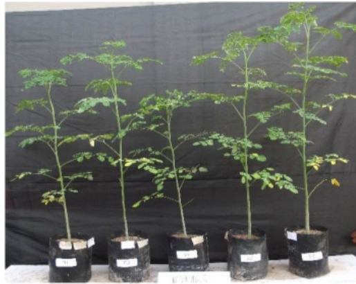
Gambar 18. Bibit tanaman kelor asal biji berumur 10 minggu pada media tanah dan berbagai macam media organik (dari kiri ke kanan: tanah, tongkol jagung, serbuk gergaji kayu, cocopeat , dan seresah daun bambu).