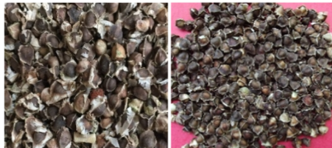
Gambar 4. Biji kelor siap sebagai benih. Biji bersayap (kiri) dan biji tidak bersayap (kanan).

Sehubungan dengan belum adanya bahan perbanyakan berupa benih tersertifikat, maka pemilihan biji yang layak untuk dijadikan sebagai benih perlu mendapat perhatian. Bahan tanam atau biji yang akan ditanam sebaiknya berasal dari biji yang sudah diseleksi dari sejak pemilihan tanaman sumber biji. Biji sebaiknya berasal dari tanaman yang tumbuh sehat, dipanen pada waktu buah polong kelor sudah lewat masak (mengering). Tanda buah yang telah masak adalah buah polong seluruhnya telah kering dan berwarna coklat. Setelah biji dikeluarkan atau dipisahkan dari polongnya, biji dikeringanginkan. Biji yang dipilih sebagai calon benih adalah biji yang sehat yaitu penampilan biji tidak keriput, cacat atau rusak, dan berwarna coklat tua. Sebaiknya biji yang terdapat warna putih di sebagian biji, jangan dipilih sebagai benih. Benih yang demikian itu memiliki viabilitas rendah.