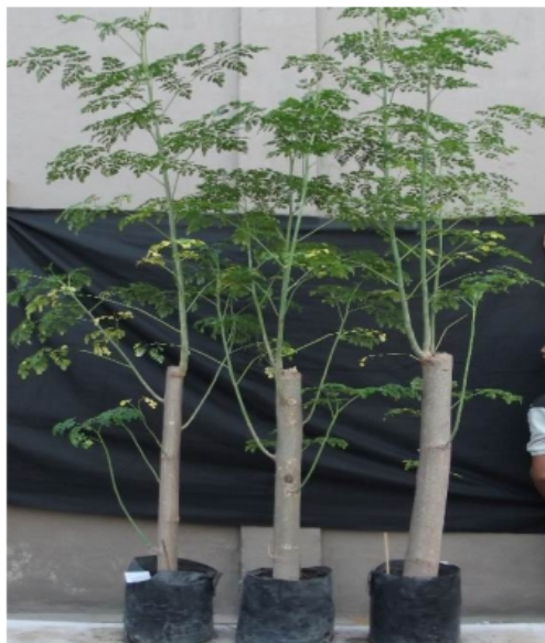
Gambar 20. Bibit tanaman kelor asal stek batang berumur 10 minggu pada berbagai ukuran (diameter stek) di media campuran tanah-sekam padi-pupuk kandang (1:1:1 v/v).