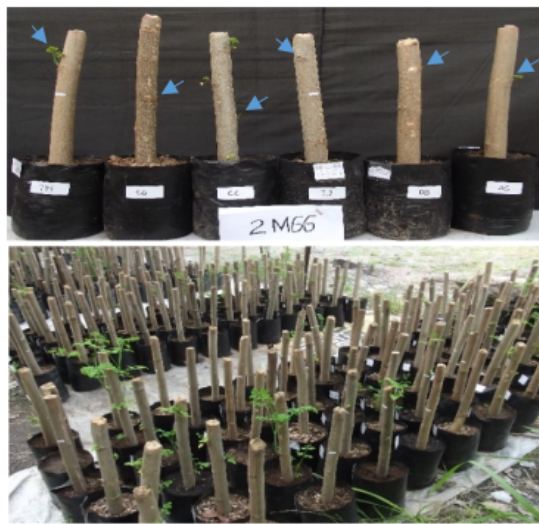
Gambar 14. Tunas telah tumbuh dan berkembang pada saat 2 minggu setelah tanam stek (atas), sedangkan pembibitan saat 3 minggu setelah tanam telah bertunas seluruhnya (bawah).

Demikian pula dengan pertumbuhan akar. Kecepatan pertumbuhan akar tergantung kepada ukuran stek dan juga jenis media pembibitan yang digunakan. Terkait dengan media pembibitan, media yang paling cepat meninduksi perakaran stek batang kelor adalah media campuran tanah dengan seresah daun bambu, kemudian campuran tanah dengan cocopeat .