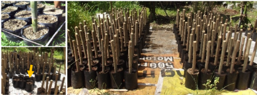
Gambar 13. Pembuatan lubang tanam pada media tanam dalam polibag dengan menggunakan alat bantu (kiri atas), polibag siap tanam (kiri bawah), dan bedengan pembibitan tanaman kelor dengan stek batang (kanan).