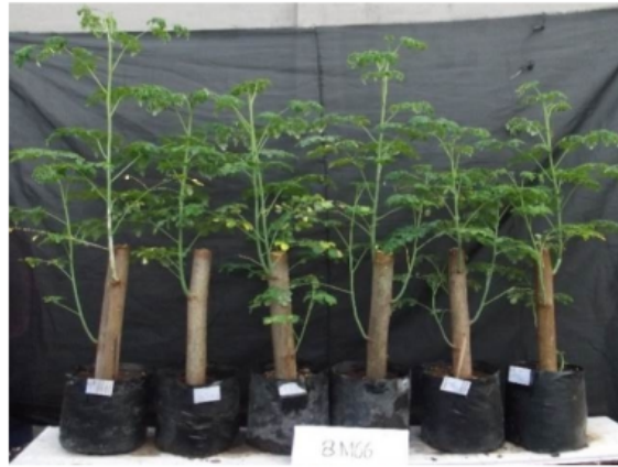
Gambar 16. Keragaan bibit kelor asal stek batang yang tumbuh pada berbagai macam medium campuran berumur 2 bulan.

bahwa sistim perakaran stek batang kelor yang baru tumbuh sangat lemah dan halus, sehingga mudah putus.