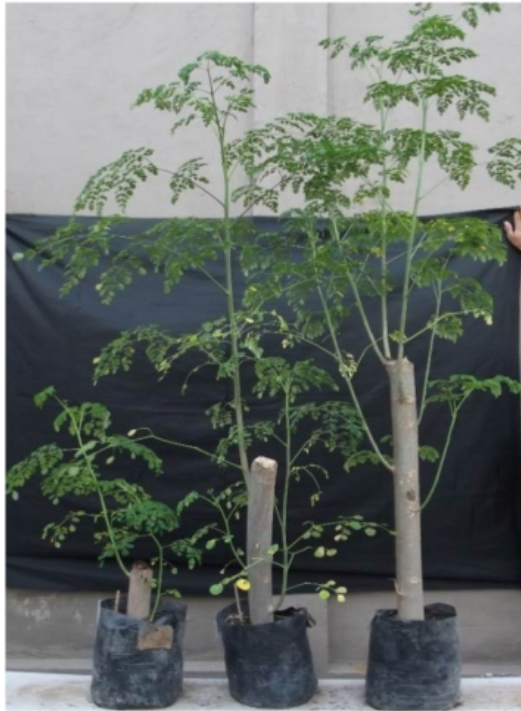
Gambar 21. Bibit tanaman kelor asal stek batang berumur 10 minggu pada berbagai ukuran (panjang stek) di media campuran tanah-sekam padi-pupuk kandang (1:1:1 v/v).