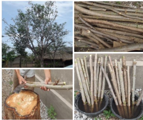
Gambar 10. Tanaman sumber bahan stek batang untuk perbanyakan tanaman kelor (kiri atas), potongan batang sebagai bahan stek (kanan atas), pemotongan batang berbagai ukuran (kiri bawah), dan stek batang yang akan ditanam tetap dijaga kelembabannya dengan cara merendam dalam air bersih.

Untuk tanaman kelor, pada dasarnya bahan stek dapat berupa stek batang bagian pangkal atau dasar, stek tengah, ataupun stek ujung. Stek batang kelor juga dapat bervariasi dalam hal ukuran diameter batang. Hasil percobaan menunjukkan bahwa bibit tanaman kelor yang baik diperoleh dari stek batang dengan panjang minimal 40 cm. Semakin besar ukuran diameter batang yang digunakan sebagai bahan perbanyakan akan semakin baik menghasilkan bibit tanaman kelor.