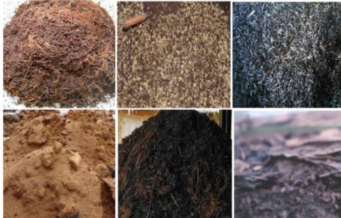
Gambar 3. Beberapa bahan organik limbah yang dapat digunakan sebagai bahan media pembibitan tanaman kelor.