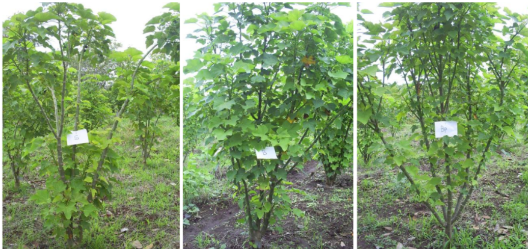
Gambar 2. Sosok tanaman jarak pagar genotipe Lombok Barat asal biji (kiri), stek (tengah), dan biji yang kemudian dipangkas (kanan) saat berumur satu tahun setelah pindah tanam.

Keterangan: kandungan minyak per satuan berat kernel dari biji kering dengan metode Ekstraksi (Folch et al. 1957 dalam Sudarmadji et al. 1997). tn = tidak nyata