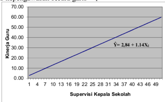
Gambar 2. Pengaruh Pelaksanaan Supervisi Kepala Sekolah terhadap Kinerja Guru

Hasil penelitian menunjukkan terhadap pengaruh secara signifikan supervisi kepala sekolah terhadap kinerja guru. Setelah diuji signifikansinya dengan menggunakan kriteria nilai sig pada taraf signifikansi \alpha = 0,05 dan df = 80 diperoleh nilai sig sebesar 0,01. Nilai tersebut < 0,05 , artinya ada pengaruh yang signifikan antara supervisi kepala sekolah terhadap kinerja guru. Adapun model persamaan regresi \hat{Y} = 2,84 + 1,14X_2 . Lebih lengkapnya tentang model pengaruh pelaksanaan supervisi kepala sekolah dengan kinerja guru dapat dilihat pada Gambar 2.