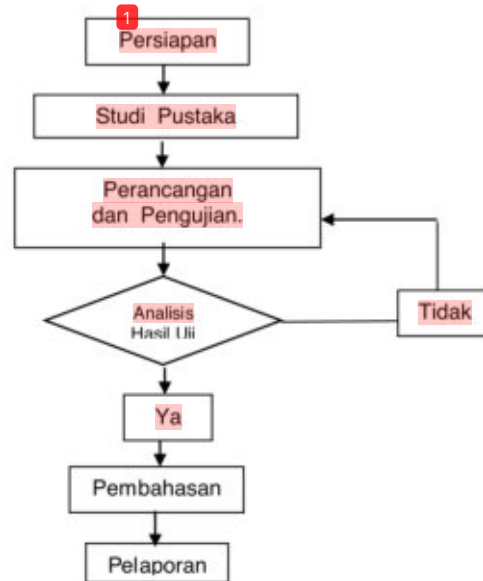
Gambar 1. Bagan alir Penelitian

Urutan kegiatan penelitian ini dilakukan seperti bagan alir Gambar 1, dari persiapan pelaksanaan, analisis data dan penyimpulan hasil penelitian ini sebagai berikut.