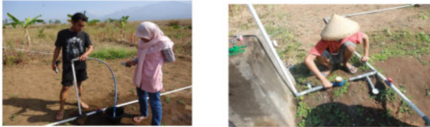
Gambar 5. Pengujian Debit Sistem Irigasi Sprinkler

Besarnya debit keluaran sprinkle mini tiga nozzle dalam penelitian ini diambil dari tiang sprinkle seperti pada gambar di bawah ini, dan debit yang digunakan dalam jaringan irigasi datanya tercatat pada flow meter yang telah terpasangan dalam jaringan.