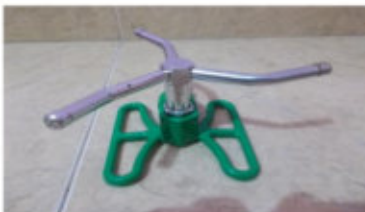
Gambar 2.a. Sprinkler Tiga Nozle

Sprinkler mini tiga nozzle yang digunakan dalam penelitian ini seperti ditunjukkan pada Gambar 2a, sedangkan rancangan petak lahan berukuran 10 m x 10 m dan jaringan irigasi sprinkler ditunjukkan pada Gambar 2b berikut.