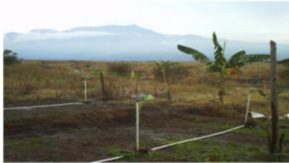
Gambar 3. Jaringan Sprinkler mini

Saluran distribusi dalam sistem irigasi sprinkler mini digunakan pipa pvc berdiameter 3" , 2" dan 1" dilengkapi flow meter , sedangkan jaringan perpipaan pada lahan digunakan pipa pvc diameter 1". dan untuk stiknya digunakan pipa berdiameter ¾". Data hasil penelitian yang akan dianalisis meliputi data keseragaman irigasi, lengas tanah setelah dan sebelum irigasi, kedalaman capaian irigasi pada kedalaman 10 cm, 20cm dan 30cm. Untuk perubahan lengas tanah setelah irigasi akan diteliti terhadap durasi irigasi yang digunakan yaitu durasi 10 menit, 20 menit, 30 menit, 40menit, 50menit dan 60 menit. Setelah melalui tahapan tersebut hasil analisis data dan pembahasan, dipresentasikan dalam bentuk grafik maupun tabel yang dibahas sampai pada kesimpulan. Kegiatan penyiapan sarana penelitian di lahan kering Pringgabaya ditunjukkan pada Gambar 3.