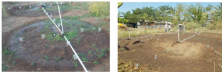
Gambar 4. Kegiatan Pengujian Keseragaman Sprinkler Mini

Kegiatan pengujian irigasi sprinkler dilakukan dalam dua tahap, yaitu pengujian 4 sprinkler secara bersamaan dan pengujian 2 sprinkler secara bersamaan. Hasil pengujian empat sprinkler secara bersamaan ternyata tidak memberikan nilai keseragaman yang baik dan rata-rata dibawah 50%, sehingga skenario irigasi 4 sprinkler secara bersamaan tidak digunakan. Kegiatan pengujian keseragaman irigasi tersebut ditunjukkan pada Gambar 4 berikut.