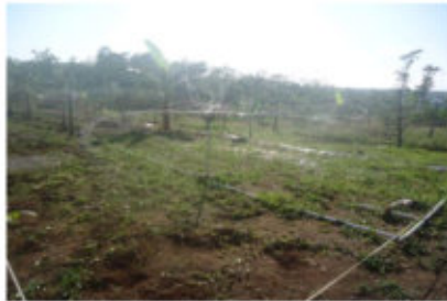
Gambar 8a. Pemberian Irigasi

Lengas tanah merupakan ukuran kinerja sistem irigasi yang digunakan, dan oleh sebab itu besarnya peningkatan lengas yang dicapai setelah pemberian irigasi sangat penting untuk diketahui. Kegiatan pemberian irigasi pada lahan penelitian dapat dilihat pada Gambar 8a berikut.