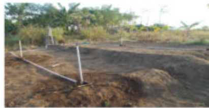
Gambar 2b. Petak Lahan dan Jaringan Irigasi Sprinkler Mini