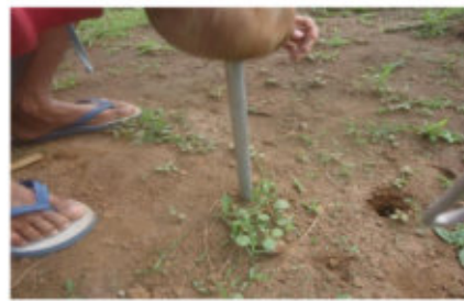
Gambar 8b. Pengambilan Sampel Tanah

Pengambilan sampel tanah setelah pemberian irigasi, dilakukan dengan menggunakan pipa pvc yang telah ditandai kedalamannya, sehingga kedalaman pada setiap titik sampel dapat diketahui. Dengan demikian maka capaian irigasi pada tiap-tiap kedalaman yang diteliti, dapat diketahui dengan lebih teliti. Data hasil pengambilan sampel tanah pada Gambar 8b, hasil pengujian lengas tanah yang diperoleh ditunjukkan pada Tabel 5.