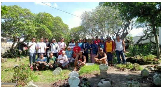
Gambar 5. Partisipasi pemuda

peradaban di desa (Reynaldi et al, 2021). Kekonsistenan dalam melaksanakan dan mengikuti kegiatan sosial yang ada di Lingkungannya menjadi salah satu langkah awal yang baik. Upaya yang dilakukan dalam peningkatan partisipasi pemudanya dengan dikatakan berhasil, karena mampu menarik minat para pemuda untuk ikut berpartisipasi dalam kegiatan sosial perkusi.