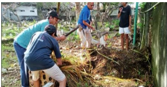
Gambar 6. Penggunaan alat saat kegiatan.

Kekurangan sarana dan prasarana ini disebabkan kurangnya kas untuk menutupi kekurangan yang ada. Dimana harga dari alat yang digunakan tidaklah murah. Karena kekurangan tersebut, panitia mencoba melakukan inisiatif, salah satunya dengan usaha menjual kaos persatuan dan menyewakan tenda keuntungannya dihibahkan untuk kas kegiatan sosial perkusi.