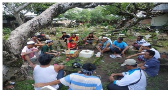
Gambar 4 . Kegiatan Diskusi

dari aktivitas hari ini dan segala bentuk program kerja dari Remaja Masjid Al Ikhlas di Lingkungan Karang Taliwang Kota Mataram. Partisipasi dalam kegiatan diskusi ini adalah para pemuda, remaja dan masyarakat yang hadir dari kegiatan bersih bersih, tetapi jika ada dari salah satu yang hadir memiliki kesibukan setelah kegiatan bersih tidak mengikuti diskusi.