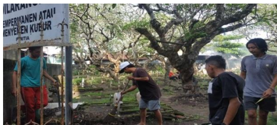
Gambar 3. Kegiatan bersih-bersi diarea kuburan