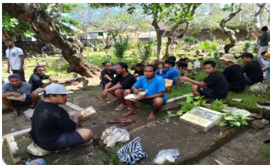
Gambar 2. Penggunaan Donasi dalam Bentuk Konsumsi

akan dibagikan ke masing-masing partisipan yang hadir.