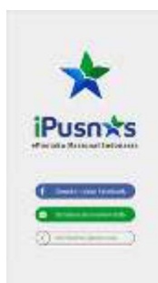
Gambar 2. Aplikasi IPUSNAS

Adapun aplikasi yang diterbitkan oleh perpustakaan daerah Provinsi Nusa Tenggara Barat yaitu aplikasi NTBelib. Aplikasi NTBelib ini dapat diakses di play store secara gratis dan isi di dalam aplikasi NTBelib ini hampir sama cara mengakses dengan aplikasi IPUSNAS. Bedanya adalah Aplikasi NTBelib ini di aksesnya sekitar provinsi Nusa Tenggara Barat saja. Adapun gambar aplikasi NTBelib sebagai berikut: