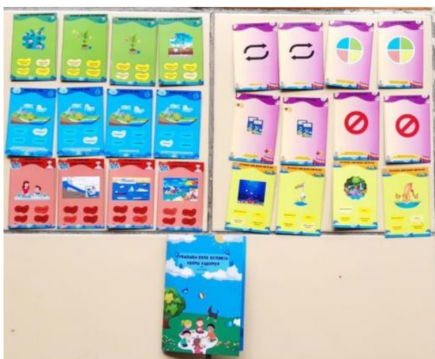
Gambar 3 Media yang sudah dicetak

Pada tahap ini produk yang telah di desain sebelumnya direalisasikan atau diwujudkan kemudian di validasi untuk mengetahui kevalidan dari media kartu kuartet dan direvisi sesuai saran dan masukan yang diperoleh dari validator. Hal ini sejalan dengan pendapat Safitri dkk (2022: 95) tahap pengembangan atau development merupakan tahap pelaksanaan produksi pembuatan media pembelajaran, menguji produk yang dirancang kepada validator ahli materi dan ahli media untuk mengetahui kevalidan produk, dan selanjutnya direvisi sesuai saran dan masukan yang diperoleh oleh validator. Berikut gambar media kartu kuartet yang sudah dicetak.