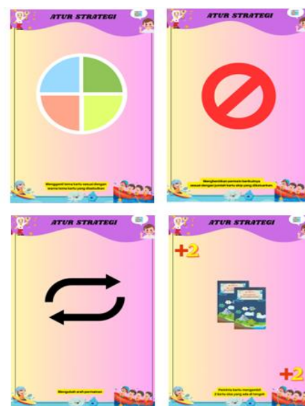
Gambar 2 Kartu Atur Strategi