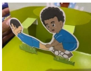
Gambar 4. Pembuatan Teknik Internal Stand

Pada bagian teknik internal stand dilakukan dengan melipat kertas dengan ukuran 3 cm x 9 cm, yang diawali dengan melipat kertas menjadi dua bagian yang sama, kemudian pada bagian sisi yang dilipat digunting horizontal dengan membentuk pola balok.