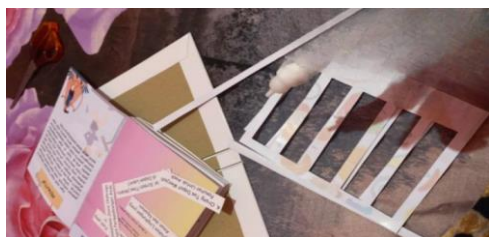
Gambar 2. Pembuatan Teknik Pull Tabs

Teknik pull-tabs dibuat dengan menggantung bagian tengah kertas sesuai pola yang telah disediakan sehingga membentuk seperti bingkai dan potongan kertas tersebut digunakan sebagai tabs atau bagian yang dapat ditarik.