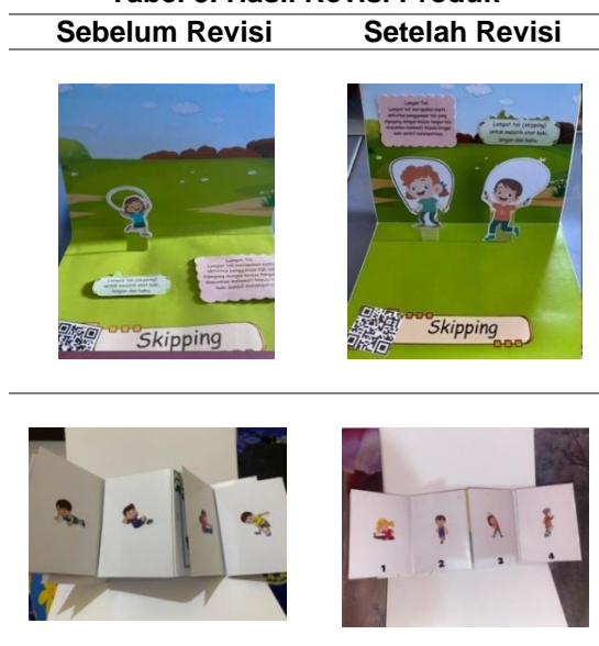
Tabel 5. Hasil Revisi Produk