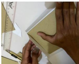
Gambar 1. Proses Pembuatan Cover

Menempelkan sampul yang sudah dicitok pada hard paper menggunakan double tape .