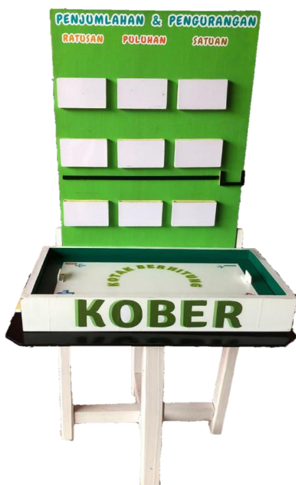
Gambar 1. Media KOBER

Pada tahap pengembangan ini merupakan kegiatan merealisasikan bentuk atau tampilan dari produk yang telah di desain menjadi media KOBER yang siap pakai. Menurut Safri (2017) tahap pengembangan merupakan tahap dimana semua bahan atau komponen yang terkumpul baik dari analisis sampai dengan desain akan diubah ke dalam bentuk media yang siap pakai. Tahap pengembangan dalam penelitian ini mencakup tahap uji validitas produk dengan melakukan validasi media dan validasi materi sampai kemudian menghasilkan media yang valid dan layak digunakan. Sebagaimana Amelia (2019) yang menyatakan bahwa tujuan dilakukannya validasi terhadap suatu produk untuk mengetahui tingkat kelayakan media yang dikembangkan. Adapun bentuk dari media KOBER yang telah dikembangkan sebagai berikut: