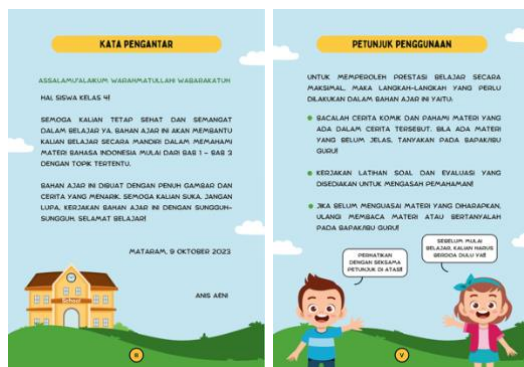
Gambar 3. Pendahuluan