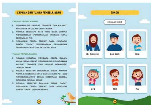
Gambar 4. Capaian Pembelajaran dan Tokoh