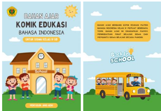
Gambar 2. Cover

Desain tampilan produk dibuat mulai dari cover sampai sumber. Berikut adalah beberapa tampilan desain produk bahan ajar komik edukasi secara keseluruhan.