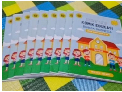
Gambar 6. Hasil Cetak Bahan Ajar

Aspek penilaian untuk validasi media menurut Ardhani (2021:37) mencakup 3 aspek penilaian yaitu tampilan, penyajian bahan ajar, dan bahan. Adapun hasil validasi ahli media disajikan pada tabel berikut.