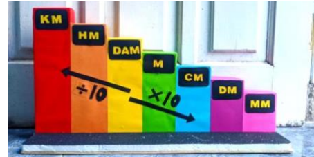
Gambar 4. Tampilan Media Tangga Pelangi yang sudah dikembangkan

seperti anak tangga yang berisi materi tentang satuan panjang serta memiliki alat dan bahan serta langkah-langkah pembuatan.