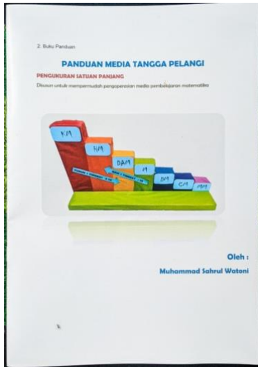
Gambar 2. Buku Panduan