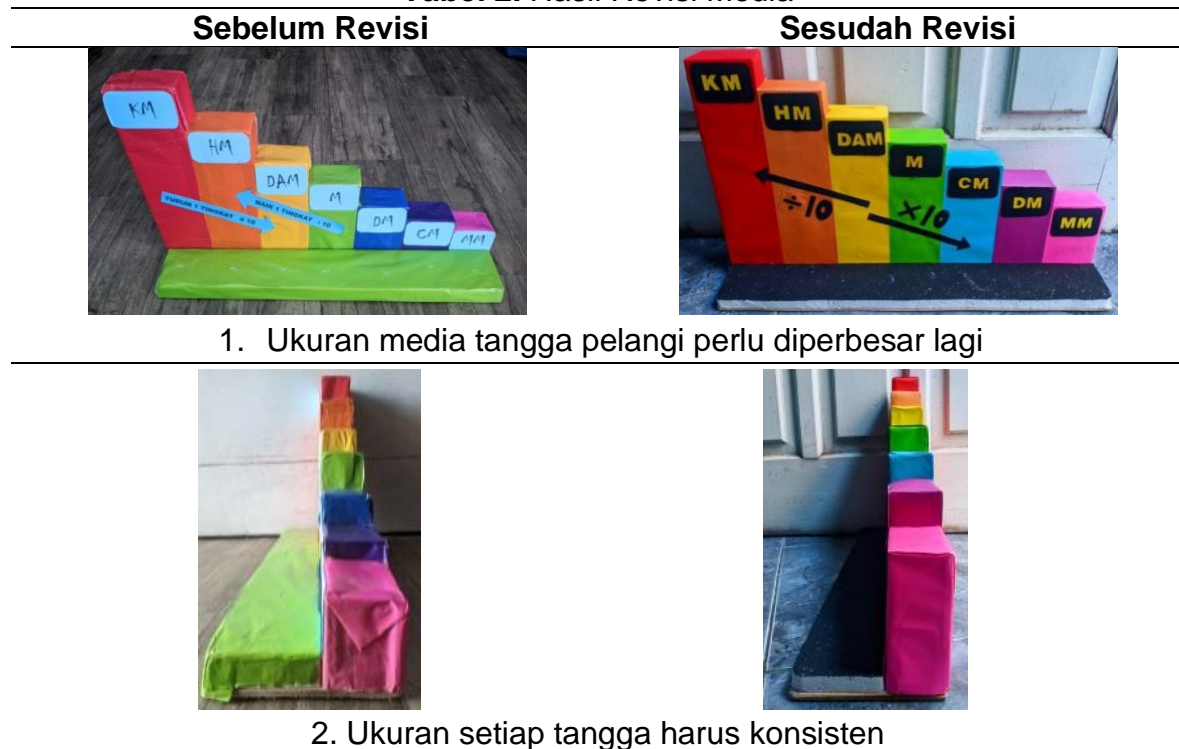
Tabel 2. Hasil Revisi Media

perlu diperbesar dan ukuran setiap tangga harus sama/konsisten.